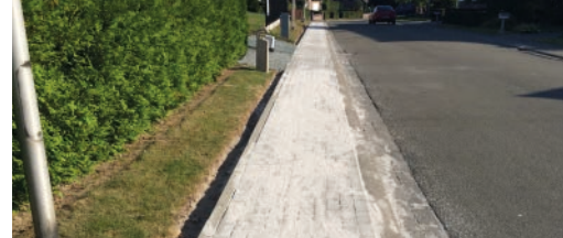
Werken en werven in Affligem p. 3