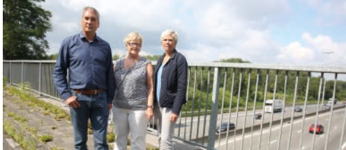
Komt brug Lombeekstraat er? p. 2